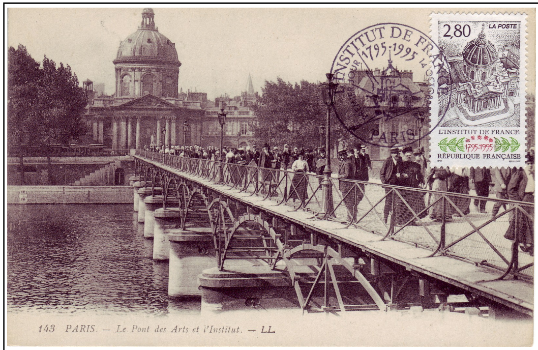
143 PARIS. — Le Pont des Arts et l'Institut.

L'Institut de France occupe à Paris, en bordure du Quartier Latin et face au Louvre, les bâtiments de l'ancien Collège des Quatre-Nations (alors destiné à l'éducation de soixante jeunes gens originaires des quatre provinces réunies au Royaume sous le gouvernement du Cardinal Mazarin. Jean-Baptiste Colbert charge Louis Le Vau d'en dresser les plans. La construction dure 20 années de 1662 à 1682. Le 4 octobre 1805, la chapelle avec La Coupole, réaménagée par Antoine Vaudoyer, est inaugurée en salle pour les séances des académiciens.