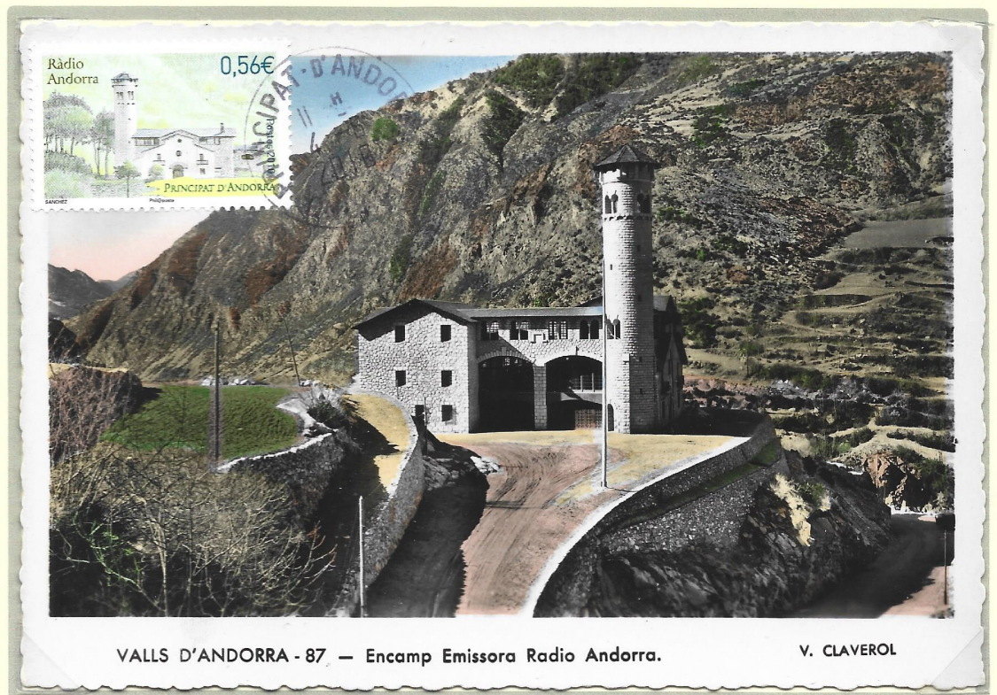
VALLS D'ANDORRA - 87 — Encamp Emissora Radio Andorra.

E : Andorre Français 2010 Ed : Escudo Oblitération ordinaire Encamp 04.06.2010