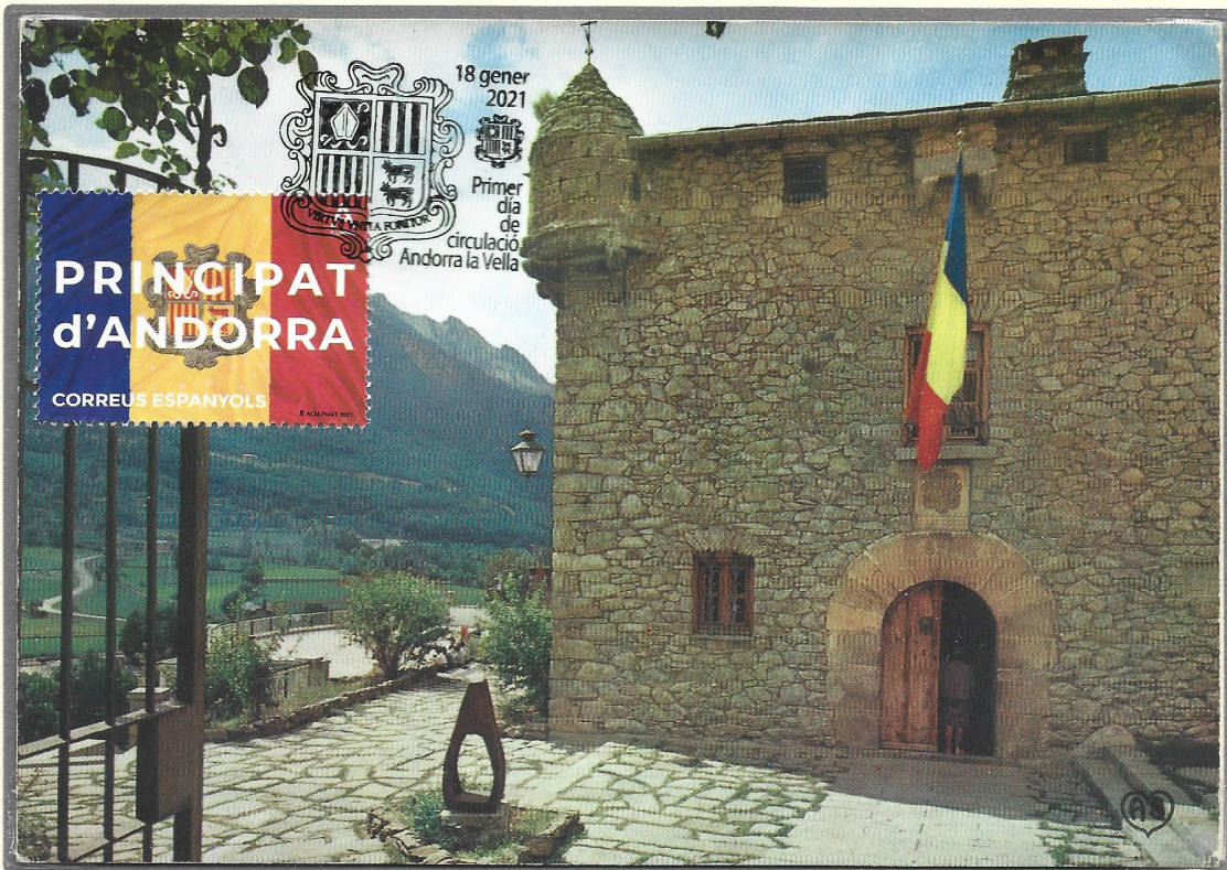
Drapeau de la principauté d'Andorre

E : Andorre Espagnol 2021 Ed : As de Coeur OPJ Andorre-la-Vieille 18.01.2021