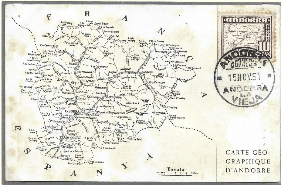
Carte des vallées d'Andorre

La principauté d'Andorre est située au sud-ouest de l'Europe et à l'est des Pyrénées entre deux membres de l'Union Européenne, la France et l'Espagne.