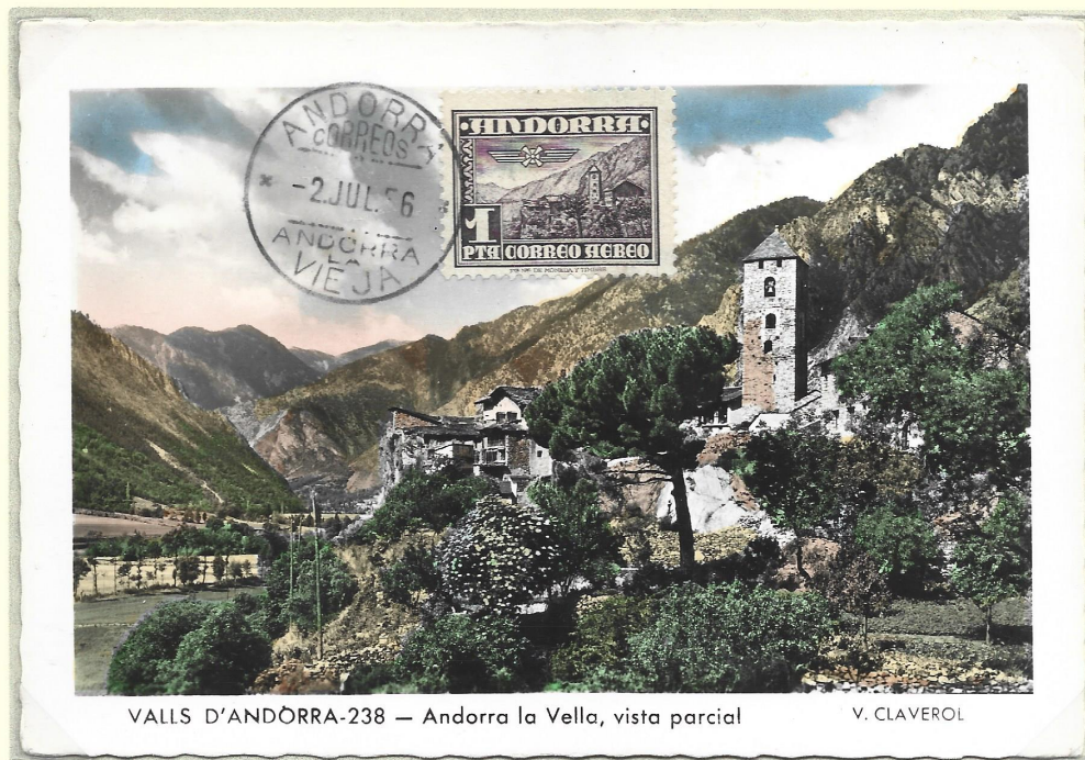
VALLS D'ANDÒRRA-238 — Andorra la Vella, vista parcial

Avec une population de 70 000 habitants, le pays est divisé en 7 paroisses (régions, territoires) : Canillo, la plus étendue, Encamp, Ordino, la plus au nord, La Massana, Andorre-la-Vieille, la plus peuplée, Sant Julià de Loria, la plus au sud et Escaldes-Engordany, la plus récente (création en 1978).