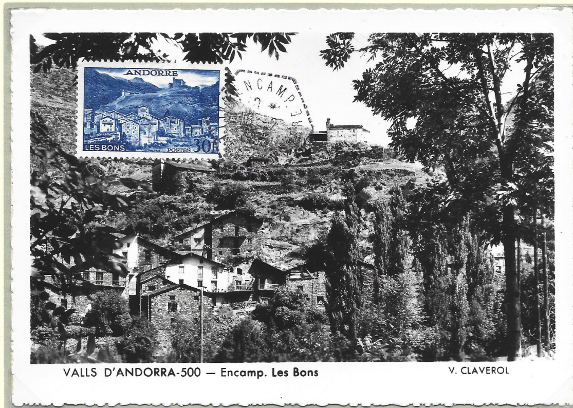
VALLS D'ANDORRA-500 — Encamp. Les Bons

E : Andorre Français 1955 Ed : V. Claverol Oblitération ordinaire Cachet hexagonal Type F4F Encamp 15.02.1955