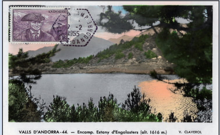
VALLS D'ANDORRA-44. — Encamp. Estany d'Engolasters (alt. 1616 m.) V. CLAVEROL

O. : ORD. OFICINA POSTAL DE ORDINO 16.10.1954 MAT. HEXAGONAL TIPO F4F P. : ED. T.K.V.