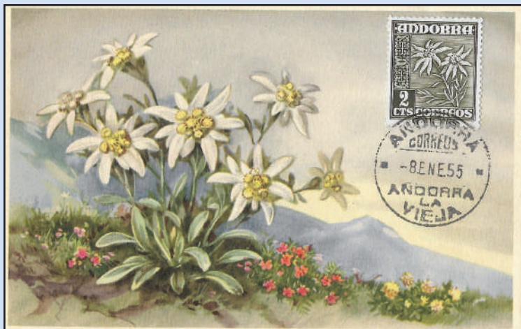
EDELWEIS E.: ANDORRA ESPAÑOLA 1948 O.: ORD. ANDORRA LA VIEJA 08.01.1955 P.: ED. COLOPRINT ESPECIAL

Esta aldea ofrece una bella estampa con sus típicas callejuelas y las ruinas de un antiguo castillo que perteneció a los Condes de Foix.