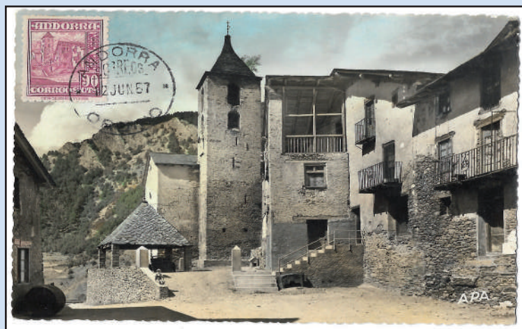
LA PLAZA DEL PUEBLO Y LA IGLESIA DE SAN CORNELI Y SAN CEBRIA E.: ANDORRA ESPAÑOLA 1948 O.: ORD. ORDINO 12.06.1957